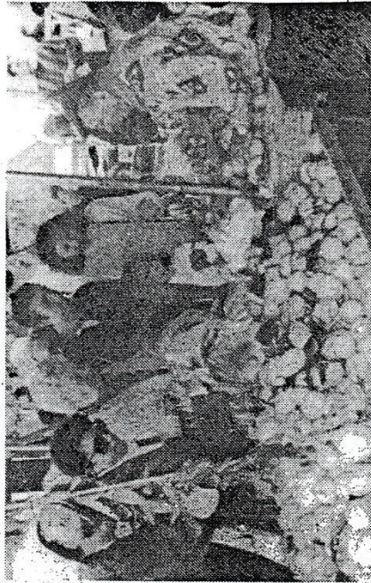
Una delle tante bancarelle di cedri

BIBBONA - Mai vista tanta gente come quest'anno alla festa del Cedro. Il centro storico di Bibbona non ce l'ha fatta a reggere l'urto di quella enorme massa che ha premuto per tutto il pomeriggio verso il capoluogo. Alcuni hanno desiderato e la visione diretta della festa del Cedro l'hanno rimandata al prossimo anno. Quella di Bibbona era l'unica festa popolare del lunedì di Pasqua che si celebrava nella zona ed era ovvio che la gran massa si riversasse proprio nel